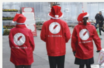
赤い羽根のロゴ入りジャンパーを着て実施しました