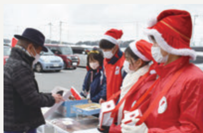
フード館前での募金活動