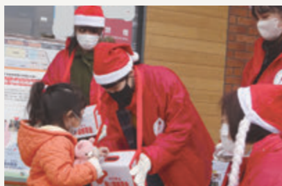
HOME & DIY 館前での募金活動