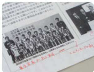
誌面がイメージしやすいよう、説明や言い換えを工夫しています。

他の人は原稿を目で追い、読んでいる内容が間違っていないか、アクセントは大丈夫か、読み方が統一されているか等を確認。読み間違えた時や周りの雑音が入った時はパソコンを止め、削除してやり直します。アクセント辞典や電子図書で内容を確認しながらの録音です。特に、箇条書きの文章や図や表など、そのまま読んでも伝わりにくい所は、内容は変えないように注意して、間を加えたり、読む順番を変えたりと工夫して読んでいます。