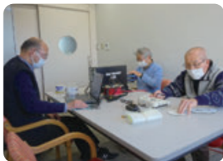
データをCDに取り込み、みなさんが聴けるかたちにお届けしています。