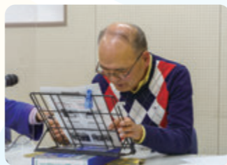
下読みは念入りに行います。

担当ページは録音日までの1週間、自分が内容を理解出来るまで読み込み、聞き手に正確に伝わるよう、文章の意味やアクセントに気をつけて何回も練習します。迷った時は仲間と相談して決定します。