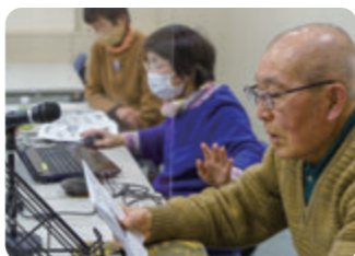
仲間を確認しながら、丁寧に吹き込んでいきます。