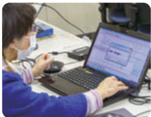
録音したデータはPCでチェック。必要に応じて修正し、音訳データとしてまとめます。

読み間違えがないか、段落、項目、ページの間が一定の秒数空いているか、音声データが内容ごとに分類され目次通りに並んでいるかなど、細かく確認し調整します。タイトルや電話番号は分かり易いように1フレーズにまとめます。また、読み手の口中音、空調の音、廊下を歩く人の話し声等の雑音も出来るだけ削除し、削除出来ない場合は再録音します。編集が終わったら最初から通して聞き直し、編集した通りに修正されているか確認します。この最終チェックの校正が非常に大切です。最終チェックが終わったら、専用の機械で音声データをCDに保存して人数分複製し利用者の元へ送られます。