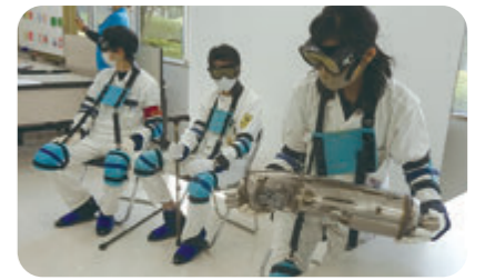
企業での体験(合志技研工業株式会社)