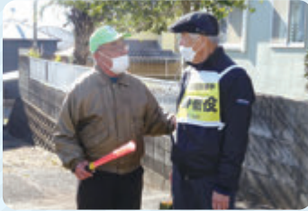
実際の地域で行うので、リアルな体験ができます。

認知症の人や、そのご家族を地域みんなで見守るための取り組みです。認知症が理由で行方不明になってしまった人(地域の方に役になりきってもらいます)を見つけて声をかける練習をします。 認知症について正しく理解し、支え合う方法を考えるきっかけとして、模擬訓練に参加してみませんか?