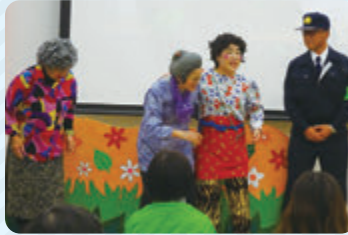
養成講座では、はってん組によるわかりやすい劇で認知症が理解できます。