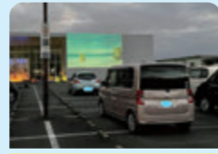
ドライブインシアター