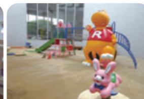
遊具がある「あそび庭」