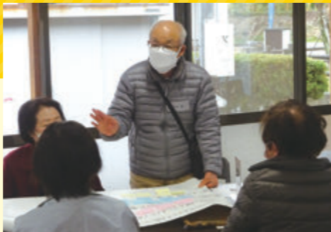
地域福祉座談会の様子