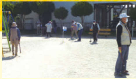
南陽区のグラウンドゴルフの様子

地域の中で行われていたグラウンドゴルフを、地域の健康づくりや生きがいづくりの場として位置づけました。