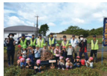
サロン会員のみなさんとこのみ坂保育園の園児

このみ坂保育園では毎週火曜日、男の井戸端サロンの皆さんとの農園活動を地域交流として行っています。日々の農園活動を通して四季折々の野菜を知り、育てる事の楽しさや作物の尊さ・収穫する事の喜びを感じています。また、給食では子ども自身が育て収穫した野菜を使った夏野菜カレーやツナピーなどを食べる事で苦手なピーマンも食べられるようになるなど、食への興味・関心が広がります。