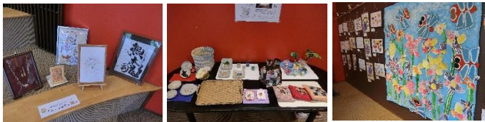
(令和2年度開催のようす)

「れんがの家アートギャラリー展」(3月予定)に向けて作品募集です。陶芸作品やアクセサリ、クラフトかご、書道など地活の活動を通して創る作品を出展しましょう。