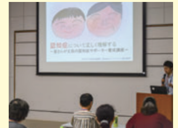
過去の養成講座の様子