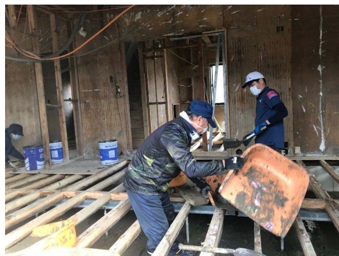
7月豪雨災害ボランティア風景②