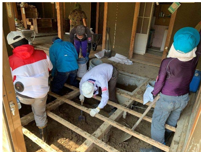
7月豪雨災害ボランティア風景①