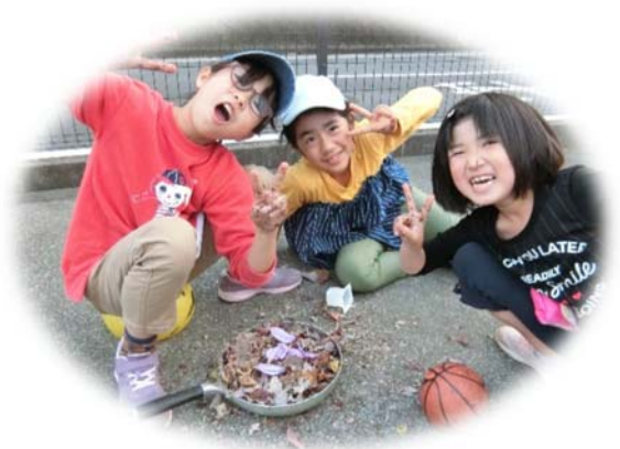
学童保育での一コマ(ピーすくらぶ)