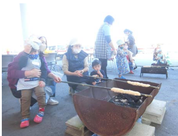
保護者会での様子