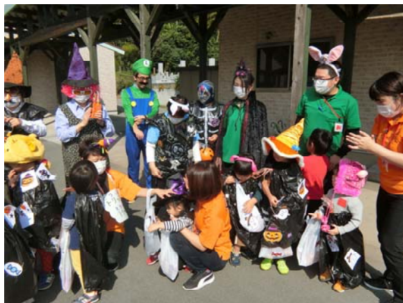
児童発達支援事業にてハロウインの様子