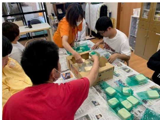
生活介護での廃油石鹼作りの様子