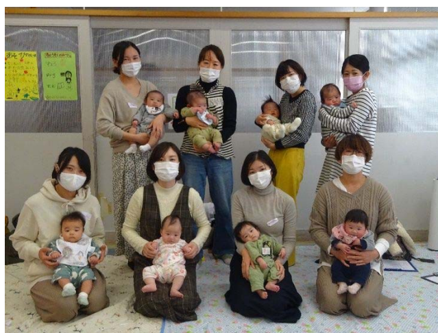
子育て支援BPプログラム参加者