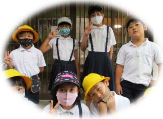
学童保育での一コマ(くすの木くらぶ)