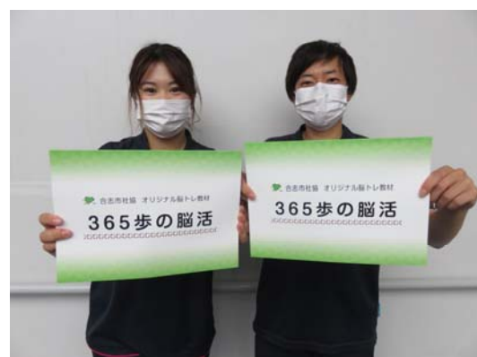
コロナ禍において気軽に取り組める認知症予防教材「365歩の脳活」発行