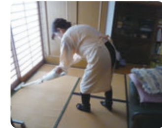
自宅内の清掃の様子

介護保険の要支援1・2の認定、または、基本チェックリストに該当された方のご自宅に訪問し、洗濯や掃除、買い物など日常生活の支援を行います。活動は市シルバー人材センターまたは社会福祉協議会に登録の上、雇用契約を結んで行います(報酬あり)。