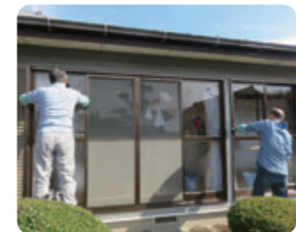
ぽっかぽかサポート活動の様子