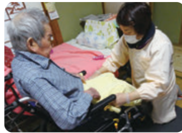
訪問介護支援時の様子

介護サービス事業所などにおいて身体介護を伴う業務に就くことができます。また、3年の実務経験を積み「介護福祉士実務者研修」を修了すると、国家資格である「介護福祉士」の受験資格を得ることができます。