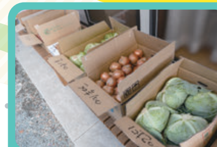
新鮮な野菜や果物を中心に取り揃えています。