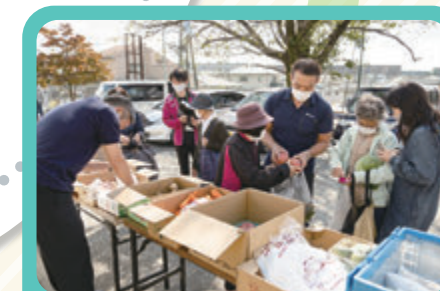
第1回目は、のべ70名以上の方がご利用されました。