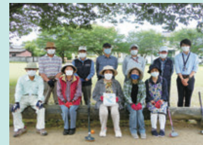
表彰を受けた「クラブみよし」のみなさん

概ね65歳以上の方々が週1回以上活動されている団体を、こうしぼちぼち元気スポットとして登録しています(無料)。元気づくりのための活動をするごとにポイントが加算され、ポイント上位の個人・団体には活動に参加して元気になった証として表彰状の授与を行っています。