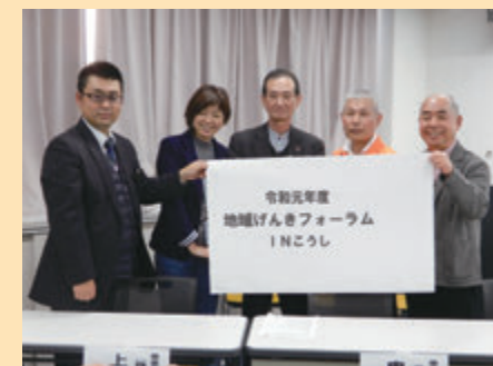
市民のみなさんと一緒に考える催しです

市民のみなさんに生活支援コーディネーターや協議体のPRと地域活動への参加促進、地域で行われている取り組みを紹介することを目的に、毎年1回行っています。高齢になっても地域で元気に、生き生きと過ごせる地域づくりについて一緒に考えています。