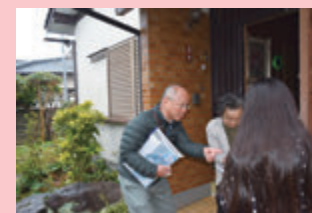
民生委員による地域の見守り活動

※「合志市地域見守り応援隊」とは、市民のみなさんで高齢者等を見守り、何か気がかりなことを感じたら、相談機関に連絡して高齢者等を支えるしくみのことです。