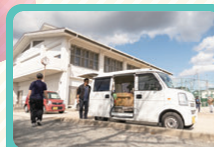
(株) 藤本物産様やJA菊池様のご協力で、地域の拠点を巡回します。