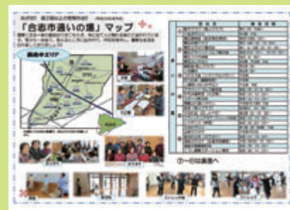
中学校区ごとにマップを作成しました

元気であり続けるためのポイントの一つに「週に1回以上外出して人とふれあうこと」が大事だと言われています。そこで、外出するきっかけになる趣味や運動など活動の場を見つけてもらえるよう、地域ごとに分けたマップを作成しました。