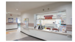
入ってすぐ右の受付に お声掛けください