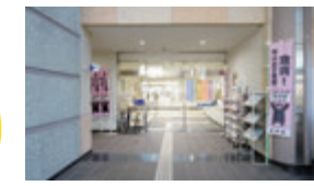
合志市総合センター ヴィーブルの中にあります