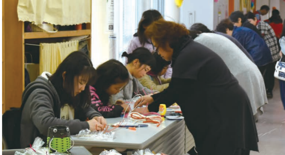
ふれあいフェスティバルでも、子どもたちにもづくりの楽しさを伝えています