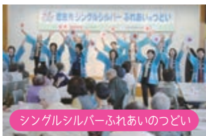
シングルシルバーふれあいのつどい

毎年12月、合志市在住の80歳以上の独居高齢者の方を対象に訪問を行っています。地区によっては小学生や子ども会などと一緒に訪問し、孤立感の防止と世代間交流につなげています。