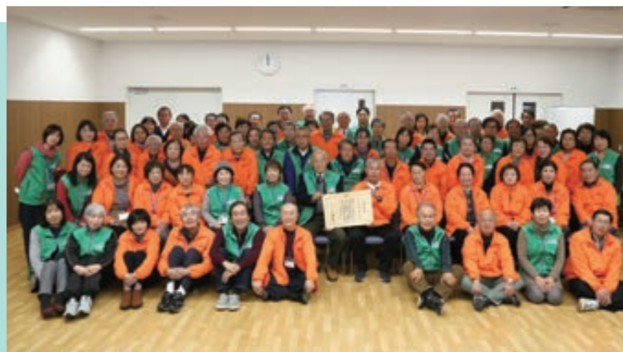
令和元年度社会福祉およびボランティア功労者厚生労働大臣表彰 受賞の記念写真

皆さんがお住まいの地域に、「民生委員・児童委員」と呼ばれる方々がいるのをご存じですか？ 民生委員・児童委員は、厚生労働大臣から委嘱された地域福祉を担うボランティアで、 合志市では98人(定員)が活動しています。平成29年には制度創設100周年を迎えた長い歴史を持つ制度です。 あなたが困った時に、いつも地域にいる身近な相談相手。その活動についてご紹介します。