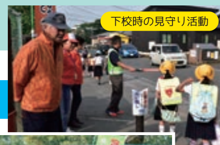
下校時の見守り活動

これからも住民の皆さんにとって「悩みや心配ごとを気軽に相談できる人」であること。また、地域の安心・安全に少しでもお役にたてる存在であれば、嬉しく思います。