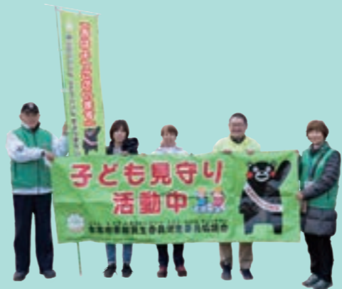
いつも笑顔で活動しています

介護や病気の悩み、妊娠や子育ての不安、失業や経済的な不安など、生活上のさまざまな心配ごとや悩みを受けとめ、必要に応じて行政や社協、その他の専門機関につないだり、適切な支援や福祉サービスが受けられるようサポートしています。