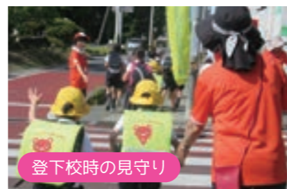
登下校時の見守り

担当地域の中で見守りが必要な方を把握し、定期的な訪問を行っています。相談を受けたときは、必要に応じて関係機関と連携し、問題の解決に努めています。