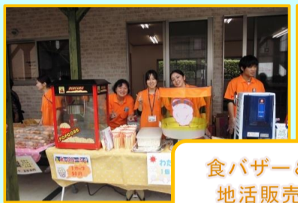
食バザー&地活販売