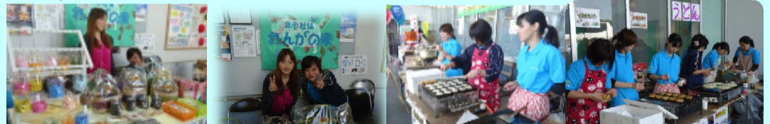
地活コーナーの看板娘です ☆食バザー也大盛況でした!

〈今月号のトピックス〉 十月三十一日にふれあいフェスティバルが開催されました。 今年は「だれかのために輝けますか?」みんなでひとつにONEピースをテーマに合志市社会福祉協議会、地域の皆様が一丸となり、今年も大盛況のうちを終りました。 「れんがの家」ではうどん、お好み焼き、回転焼、燻製の食バザーのほか、地活のクラフトかご等の販売会を行いました。 午後には食バザーもほぼ完売し、地活販売会もご好評を頂き、売り上げも好調でした。 地活のクラフトかご等はすべて地活のご利用者様の手作りです、一点一点に気持ちが入り込められたものになっていきます。 現在は弁天での販売も行われており、今後も様々な場所で販売会を行う予定です。機会がありましたら気持ちのこもった商品を皆様に手にとって頂ければと思います。 食バザー、地活商品を購入いただいた皆様、ご来場いただいた皆様、誠にありがとうございました!