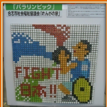
ゆめアートコンクール 2012 審査員特別賞受賞

今後の発表の場 ★くまもとハートウィーク 県内の障がい者芸術展 日時:11月20日(火)~11月25日(日) 会場:熊本県立美術館別館 ★れんがの家主催 「ふれあい文化祭」 日時:11月24日(土)13時~16時 会場:ふれあい館交流ホール