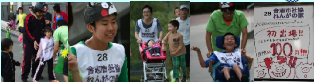
UDリレーマラソンの様子 みなさん見事な走りでした!

〈放課後デイサービス〉 ・回中一時支援事業 十月八日に行われたRKKスポーツUDリレーマラソンに参加しました。 ゆっくりでも、全力疾走でも八時間タスキをつなぎ完走を目指す競技です。当初設定していた目標の六十周を大きく超え、なんと九十五周をみんなの力で走りぬきました! 日中、児童デイ、地活のご利用者様とその御家族に社協職員と多数の参加をしていただき、普段あまり見ることのできない家族との児童の姿や、八時間耐久という長い時間の中で一生懸命に走る姿を目にすることができました。 十月二十八日のテレビ放送では、「れんがの家」チームを取り上げ編集してありました。一生懸命走ってる参加者の姿を見てあらためて感動しました。来年は百周を目指し、がんばります! 今回は残念ながら参加できなかった方も来年のご参加もお待ちしております。