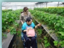
《親子揃ってイチゴ狩り》