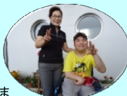
《いつも笑顔のお母様と》