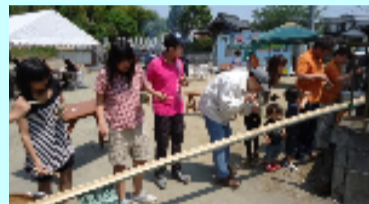
そうめんが流れてきたよ〜!