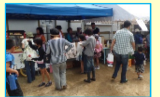
◀回転焼きが大人気▶

焼きそば・回転焼き等の食バザーには行列できる程の大盛況でした。地域活動センターの活動で制作した陶芸作品やクラフト籠のバザーも作品の大半を販売してしまうくらい大人気でした。