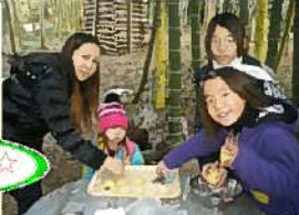
『石窯で簡単アウトドアクッキング』H21.12.19