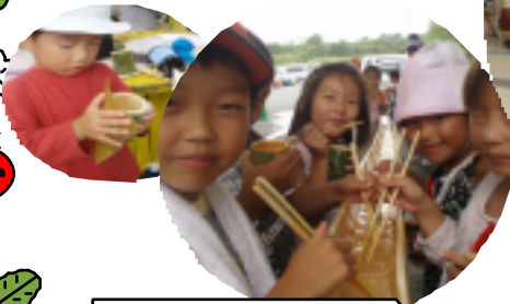
プレイパーク竹細工 & 流しそうめん