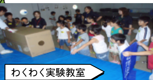
わくわく実験教室