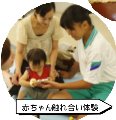
赤ちゃん触れ合い体験