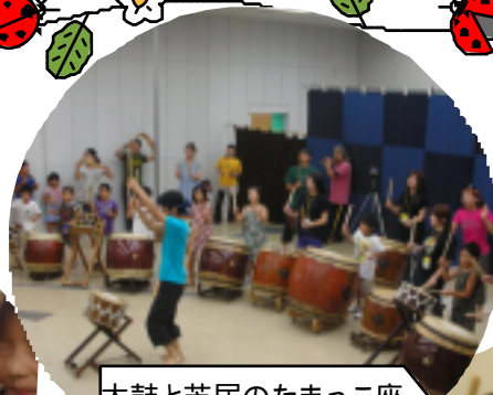
太鼓と芝居のたまっこ座 『いちにのドン』