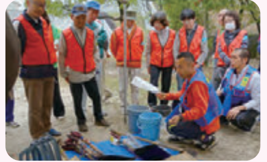
災害時のボランティア活動 災害ボランティアセンター設置訓練