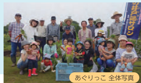
あぐりっこ 全体写真