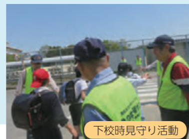
下校時見守り活動