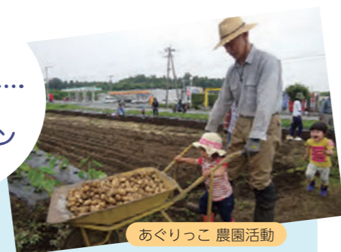
あぐりっこ 農園活動

ランティア活動として下校時の見守り活動、福祉施設の訪問など「できること」を大切に、無理せず楽しみながら活動を続けています。モチベーションアップのための会員同士の交流も欠かしません。みなさんもちよっと「かたって」みませんか?