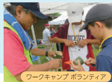
ワークキャンプ ボランティア