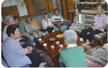
住民同士のつながりづくり ぽっかぽかサポート