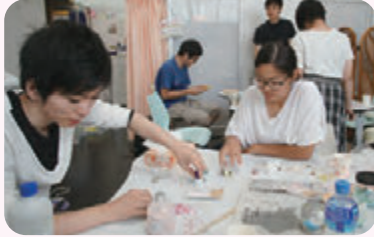
中高生の居場所づくりと青少年健全育成活動 オモイカタルバ