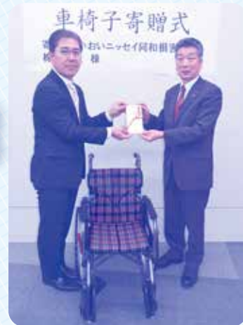
あいおいニッセイ同和損害保険株式会社様より車椅子寄贈の様子

合志市社協では車椅子の貸出事業を行うとともに、下記「福祉体験教育」のカリキュラムとして、「車椅子体験教室」を各種学校等へ出向いて行っております。