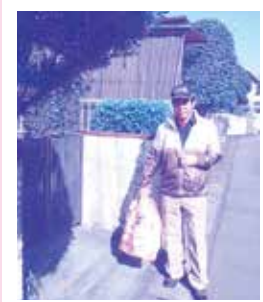
日常的なゴミ出し

活動にご興味ある方、何かこれから始めてみようとお考えの方、協力会員として活動してみませんか。お気軽にお問合せください。