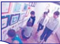
放 みんなの紹介写真もあるよ!