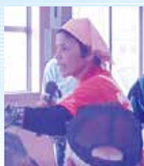
(食生活改善推進員)