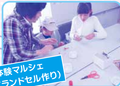
体験マルシェ (ミニランドセル作り)