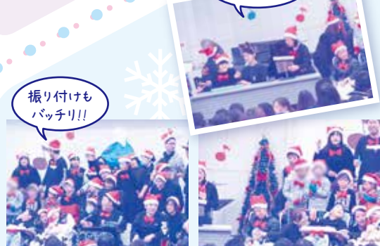
振り付けもバッチリ!!