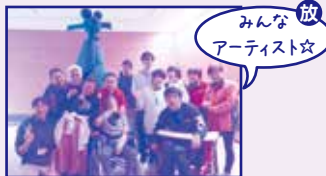
みんな放 アーティスト☆