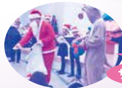
サンタ・トナカイ登場

12月8日(土)に開催され、300人程の参加者で、ヴァイオリン、ピアノ、フルート、パーカッションの演奏や歌、ダンスの発表を楽しみました。