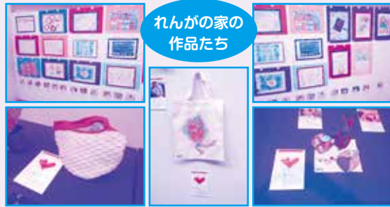
れんがの家の作品たち

放課後等デイサービスのこどもたち、生活介護、地域活動支援センターのご利用者さんが日頃の活動の中で制作した作品の数々。ひとりひとりが作家さん…個性豊かな作品が多く、輝いていました。