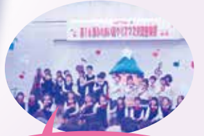
キッズ・ビーずクラブ