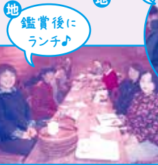
地 鑑賞後にランチ♪