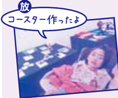
放 コースター作ったよ