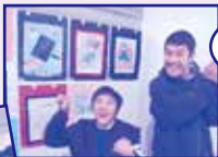
放 高校生最後の作品だよ☆