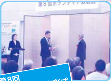
第8回 ボランティア表彰式