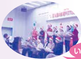
いきいきサロン温団