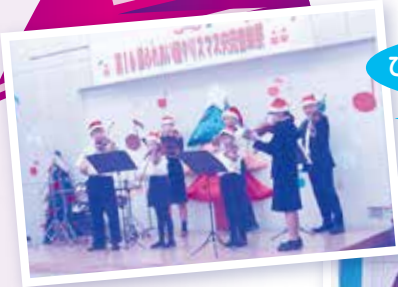
ひろせたくとなかまたち