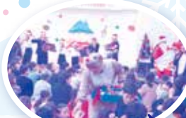
トナカイさんプレゼントありがとうございます