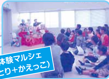
体験マルシェ (とり+かえっこ)