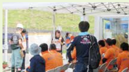
災害ボランティアセンターの様子