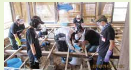
ボランティア活動の様子