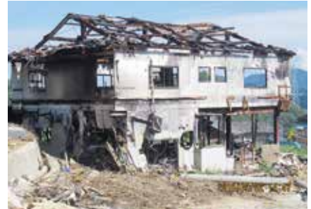
広島県三原市の様子