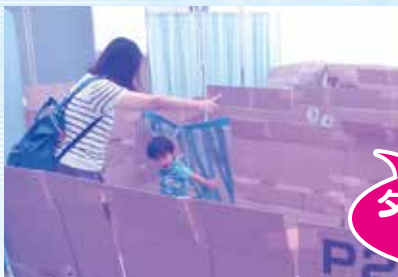
ダンボール迷路 出現