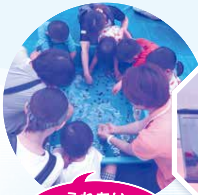
ふれあい ミニ水族館が やってきた!!