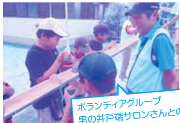
ボランティアグループ 男の井戸端サロンさんとの そうめん流し