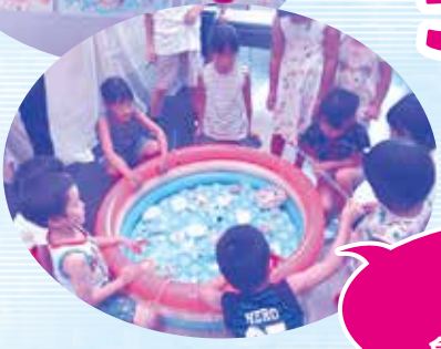
キッズクラブ 手作りの 魚釣りゲーム♪