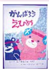
〈愛媛県庁ロビー展示中〉

愛媛県では、応援メッセージを『えひめ』の多くの子ども達に届けたいという思いから、県庁ロビーに作品が展示され、その後児童館を巡回展示される予定です。