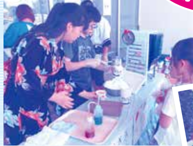
かき氷 焼きそば ポップコーン