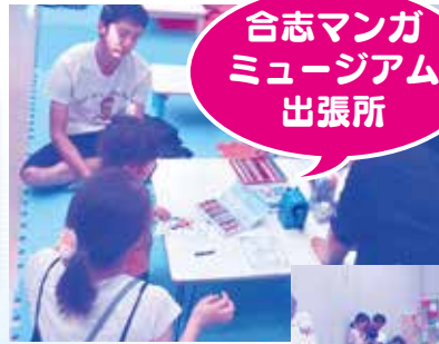
合志マンガ ミュージアム 出張所

ワークショップ（塗り 絵、つけペン体験）も あり、子どもから大人 までゆっくりと楽しんで いました♪