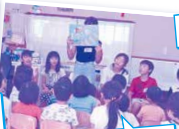
保育園で園児との交流