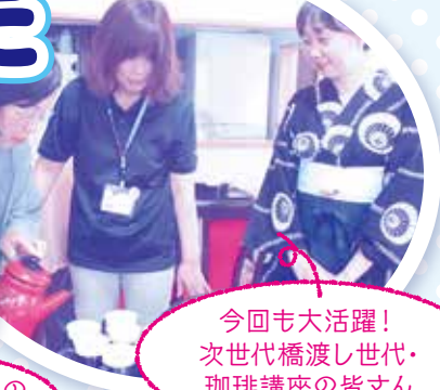
今回も大活躍! 次世代橋渡し世代・ 珈琲講座の皆さん