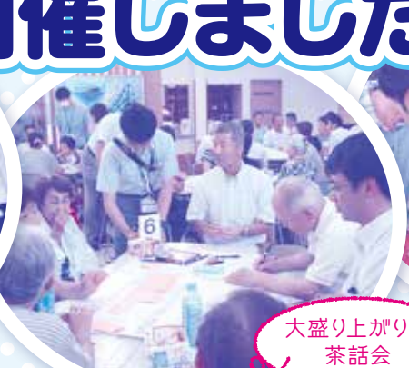
大盛り上がり の茶話会