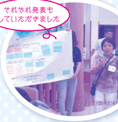
それぞれ発表も していたがきました

特別養護老人ホーム菊香園との協働事業として、住民のみなさんと一緒にこれからの“自分の街”=“合志市”について真剣に、そして、楽しみながら話し合いました。おいしい珈琲をいただきながら、それぞれの立場で「自分に何ができるだろう?」「こういう街にしていきたい!」という思いをみんなで分かち合いました。