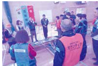
昨年の訓練の様子