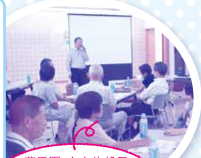
菊香園・水上施設長 「笑顔あふれる地域に したいですね!」

特別養護老人ホーム菊香園との協働事業として、住民のみなさんと一緒にこれからの“自分の街”=“合志市”について真剣に、そして、楽しみながら話し合いました。おいしい珈琲をいただきながら、それぞれの立場で「自分に何ができるだろう?」「こういう街にしていきたい!」という思いをみんなで分かち合いました。