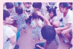
保育園児との交流