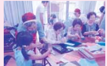
高齢者サロン (七夕飾り作り)

地域の方々と協働し、高齢者を対象に参加しやすい地域内の公民館等に「つどいの場」を設置することで、仲間づくりと閉じこもり防止や福祉問題の早期発見につなげている。また、介護予防効果と住民同士の交流促進から互いに見守りあえる地域づくりを実施した。