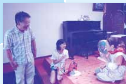
福祉やボランティアについて学ぶ 『夏休みワークキャンプ』

自分ができる事や、やってみたいと思う事、また身近にできる“ちょっと”した活動を通して『人を知り』『地域を知り』『福祉を感じる』ことができます。