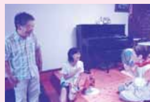
民生児童委員と一人暮らし高齢者宅訪問