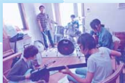
音楽を通じた居場所づくり 『中高生バンド』

合志市社協では、地域の担い手の輪をつなげ、地域の福祉力を高めるため、若者も気軽に社会参加できるような活動や取り組み、居場所づくりを実施しています。