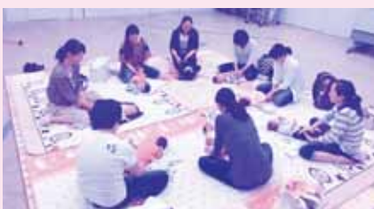
ベビープログラム(親子の絆づくりプログラム) 生後2ヶ月からの第一子をお持ちのお母さんのためのつどい