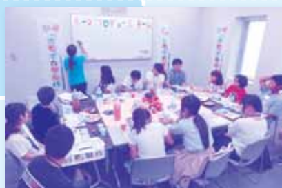
イベント活動やボランティアで仲間づくり 『オモイカタルバ』