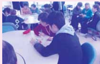
スマートフォン講座

定年退職された年代を含む高齢者の地域における社会参 加の促進を図った。趣味・興味を大きく広げ、健康寿命の延 伸を図ることを目的に、「木工教室」「男性の料理教室」を開 催。また、平成28年度から開催している「スマートフォン講 座」には、定員をはるかに超える申し込みがあり、熊本高等 専門学校の生徒さんによる親切丁寧な説明を受け、若い世 代との交流も実現した。