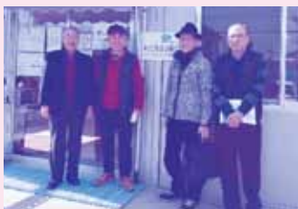
ぽっかぽかサポーター (リーダー・サブリーダー)の皆さん

住民のちょっとしたお困りごとを住民同士で支 えあう「ぽっかぽかサポート事業」を実施・運営。 また、「ふら〜っとホーム太陽」を拠点に、地域住 民(サポーター)による安否確認・電話での「お 元気コール」を実施した。