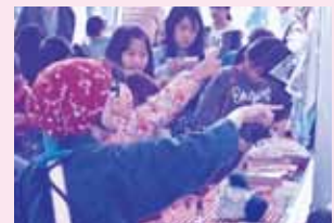
ふれあいフェスティバル