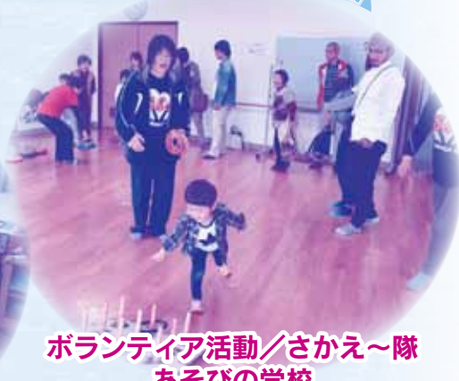
ボランティア活動／さかえ〜隊 あそびの学校

今回の特集内容として、ウェルネスシティこうしや特別養護老人ホーム菊香園等との民間事業所・企業連携の取りくみをご紹介します。