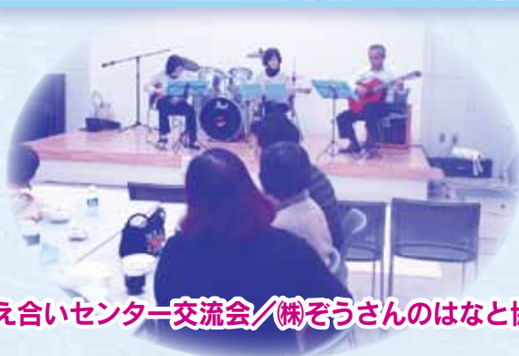
支え合いセンター交流会／(株)ぞうさんのはなと協働