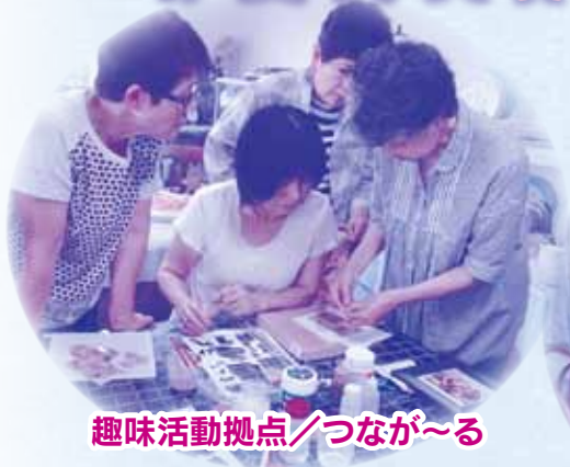
趣味活動拠点／つなが〜る