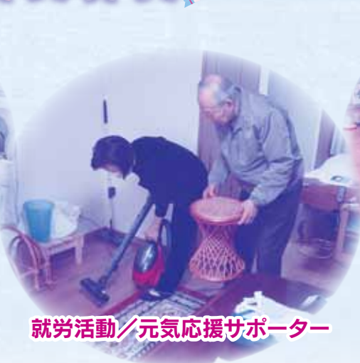
就労活動／元気応援サポーター