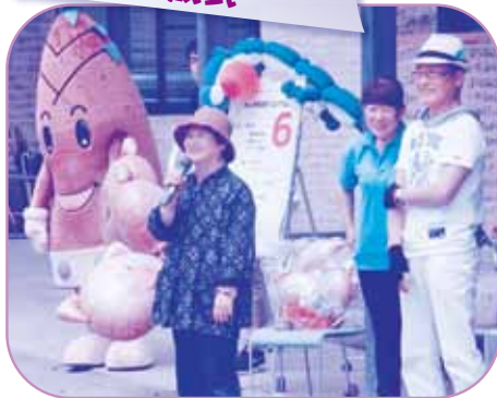
ホワイトエンジェル 結成式

れんがの家での行事や作業等お手 伝いしていただけるボランティアさ んをホワイトエンジェルと銘打っ て結成式を行いました。まだまだた くさんのボランティアさんを募集し ています。お気軽にご参加ください。