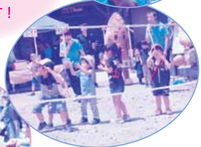
お楽しみ抽選会 賞品ゲット！