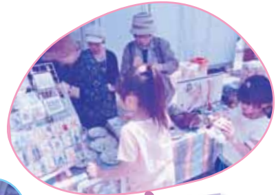
食バザーや ゲーム大会も 大好評！