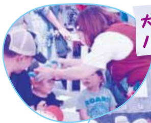
大盛り上がりの バルーンアートショー☆

「れんがの家」は今年で6年目を迎えます。改めてご利用者や地域のみなさんに支えられている のだと感謝した一日となりました。今後とも「れんがの家」をどうぞよろしく願いいたします！