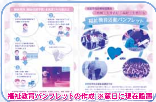
福祉教育パンフレットの作成 ※窓口にて現在設置

毎年各学校へ訪問し、様々な福祉体験（人を思いやる気持ちを育む）活動を実施しています！もちろん、地域の方々にとっても「福祉」を感じていただく活動も行っています。