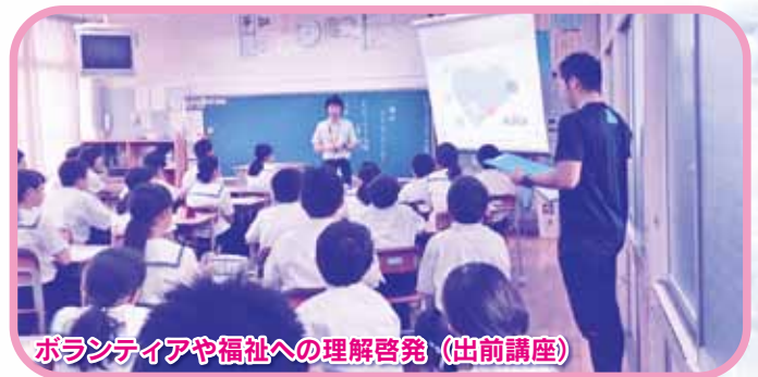
ボランティアや福祉への理解啓発（出前講座）