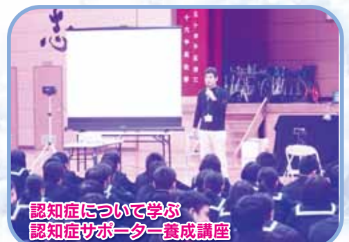
認知症について学ぶ 認知症サポーター養成講座

市民一人ひとりがまわりの人を、地域を思いやるあたたかいまちづくりを社会福祉協議会では今後も推進していきます。