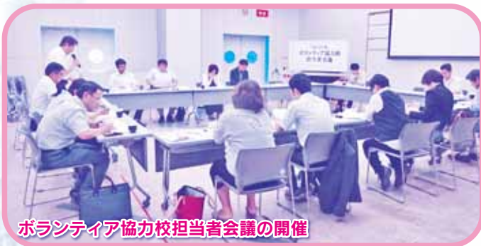
ボランティア協力校担当者会議の開催

各学校独自の特色あるボランティア活動を行い（収集ボランティア、高齢者との交流等）地域の方々との協働で、ボランティア意識の啓発を行っています。