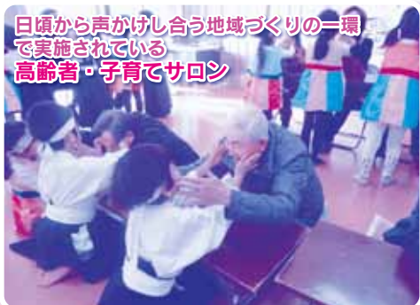
日頃から声かけし合う地域づくりの一環で実施されている 高齢者・子育てサロン

そして今後、またいつ災害が発生するかわかりません。社会福祉協議会では、日頃から地域のつながり・絆を深める活動や生活のお困りごとに対応する相談窓口や訪問活動を実施しています。