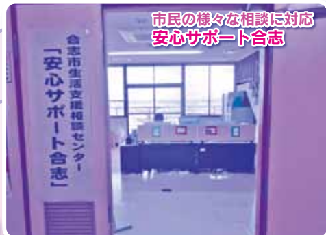
市民の様々な相談に対応 安心サポート合志