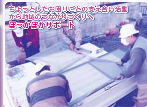
ちょっとしたお困りごとの支え合い活動から地域のつながりづくりへ ぼっかぼかサポート