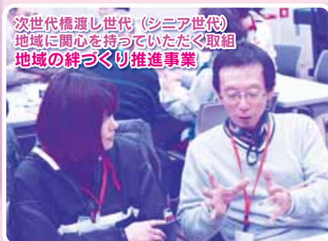
次世代橋渡し世代（シニア世代） 地域に関心を持っていただく取組 地域の絆づくり推進事業