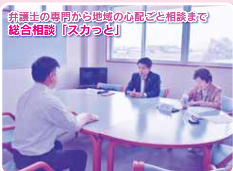
弁護士の専門から地域の心配ごと相談まで 総合相談「スカっと」