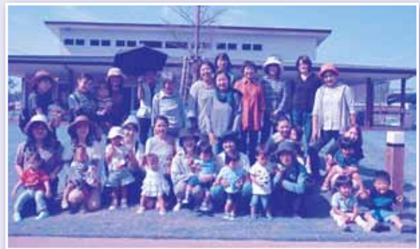
『めだかサロン』(若原公民館)

美味しい食事、外出、卒園児との交流などお楽しみいっぱいサロンです。たくさんのボランティアの中には子育て中のママも活躍中です(*^_^*)お近くの方遊びに来てください!!