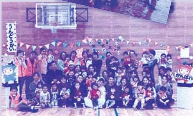
ふれあい交流運動会