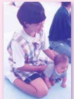
ワークキャンプ (赤ちゃんふれあい体験)

夏休み期間に小・中・高校生、それぞれを対象にワークキャンプを実施し、小学生は民生児童委員の活動を知るために高齢者のお宅を訪問、交流を行った。中学・高校生は乳幼児とのふれあいと助産師による講話、また妊婦体験とおして、命の尊さを再確認する機会とした。