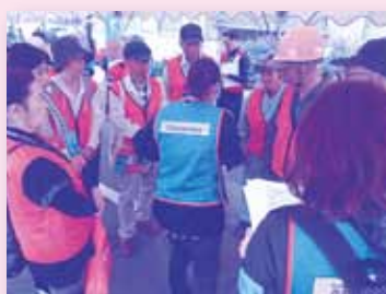
災害ボランティアセンター設置訓練

災害時のボランティアの役割を学ぶ災害ボランティアセンター設置訓練の実施や、児童青少年に向けて「福祉」の理解を深める体験学習等を実施した。