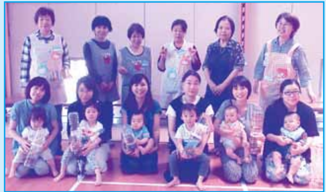
『パンダサロン』 みんなで一緒に楽しく遊ぼうがモットー!! (杉並台コミュニティセンター)

子育て中の方が地域の公民館などに集まって、育児についての悩みを共有し、仲間づくりや情報交換、季節の行事などの体験を通して、お互いの交流を深めています。ボランティアの方々などが中心となって、子育てを地域ぐるみで支えあっています。