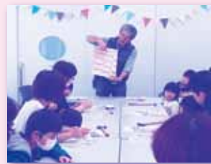
ふれあいフェスティバル (木工体験)

福祉啓発・住民交流を目的としたふれあいフェスティバルは、「心の音色でつむぐ地域の仕合わせ」と題