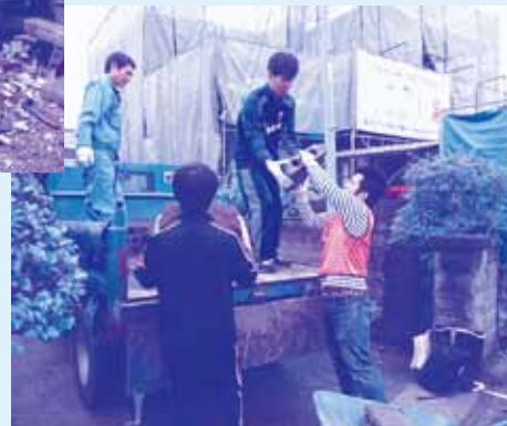
ブロックの 運び出し ボランティア