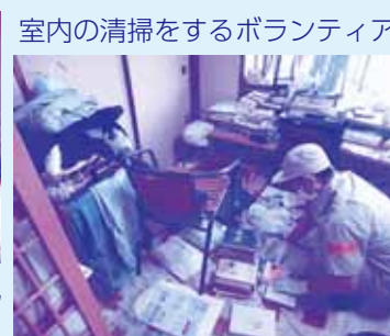
室内の清掃をするボランティア