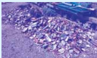
たくさんの落ちた瓦

民生児童委員の方々にご協力いただき、県 内の中でもいち早く復旧活動を開始いたしま した。(4月19日(火)～随時開始)