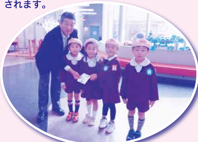
リズム幼稚園の園児さんから

皆様からの善意の募金は熊本県共同募金会を通じて様々な地域の課題を解決するための活動を行う団体や、災害発生時の被災者支援のために助成されます。