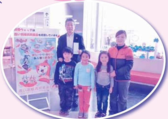
愛泉保育園の園児さんから