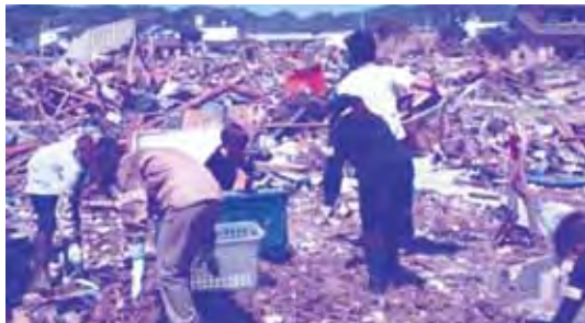
東日本大震災時のボランティア活動の様子