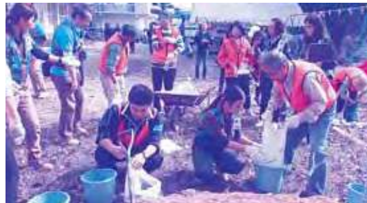
昨年度の合志市災害ボランティアセンター設置訓練の様子(土のう詰め体験)