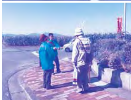
過去の実施の様子