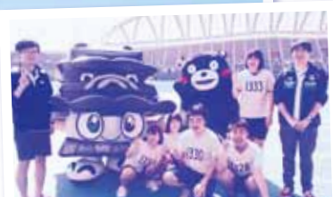
肥後丸・くまモンと記念撮影