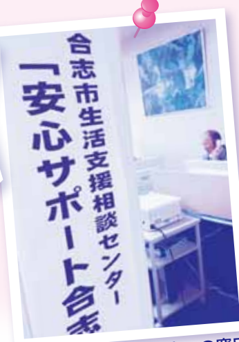
生活に困っている方々の窓口 「安心サポート合志」