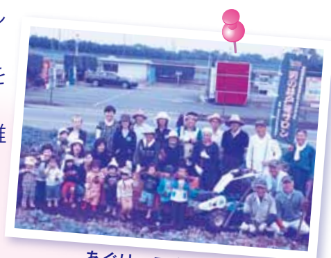
あぐりっこくらぶと、 デイサービス利用者とのふれあい芋ほり