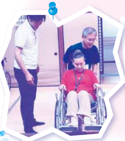
生活介護支援サポーター養成講座