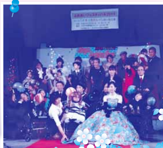
れんがファッションショーの様子