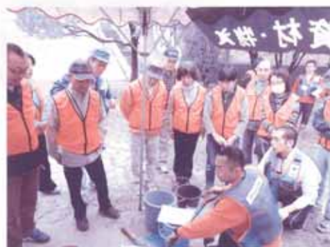
平成25年度 合志市での災害ボランティア設置訓練の様子▲

人と人との つながり を生みだし、あなた自身を、またあなたの家族を、そして地域を救うかもしれません…。