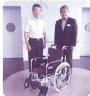
住友生命労組 熊本支部様より車いすを寄贈して頂きました。