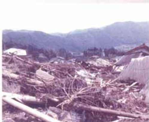
▲平成24年7月九州北部豪雨災害時の様子