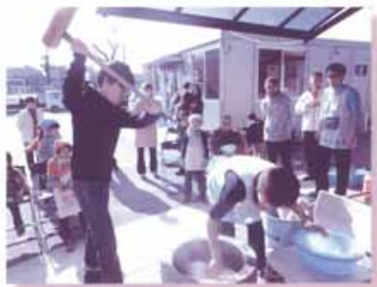
「地域交流もちつき大会」