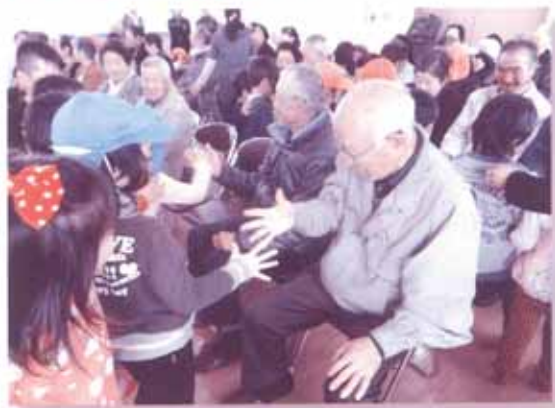
「高齢者と園児との異世代交流事業」

ふれあいフェスティバル(678名)、見守りネットワーク(ボランティア737名)、異世代間交流(972名)、各種福祉団体・地域福祉活動助成事業、ひとり暮らし高齢者交流会(413名)、歳末時ひとり暮らし高齢者訪問(445件)、障がい児・者療育サロン(49名)、おもちゃ図書館・音楽クラブ(156名)