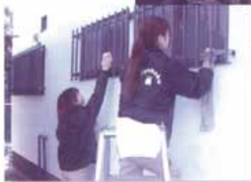
←「ぽっかぽかサポーターによる窓拭き支援」