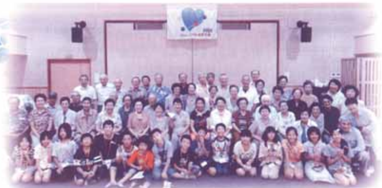
「ワークキャンプ生（小学生）と高齢者サロンの交流会」