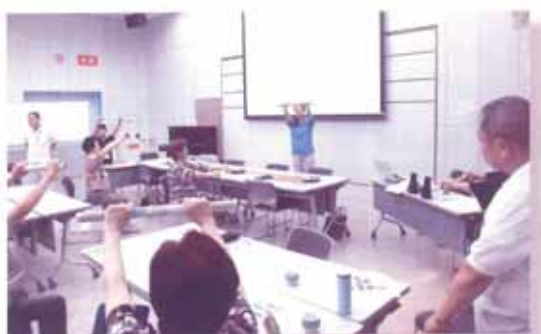
↑「脳いきいき教室(ふれあい館)」