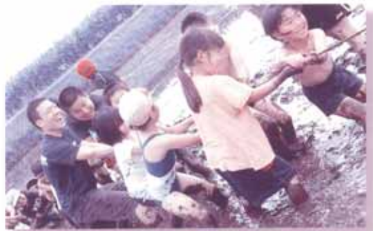
「食育・生きる力を育む交流事業：どろりんピック」