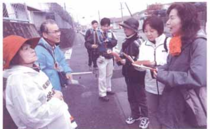
「認知症徘徊模擬訓練」

※事業報告書及び決算書はホームページにて公表しています。また、本所のふれあい館でも閲覧することができます。