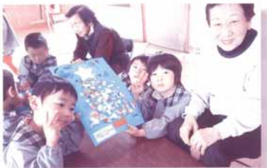
「高齢者の生きがいと居場所づくり：サロン事業」