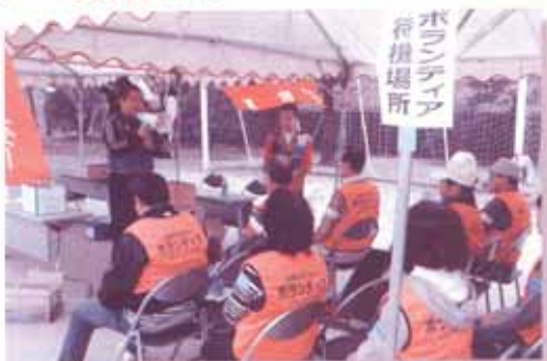
「災害ボランティアセンター設置訓練」

ボランティア体験学習(55名)、ボランティア登録(1,496名)、ボランティア指定校生徒数(6,179名)、ボランティアコーディネート(548件)、災害ボランティアセンター設置訓練(3回:のべ200名)、ボランティア交流会(193名)