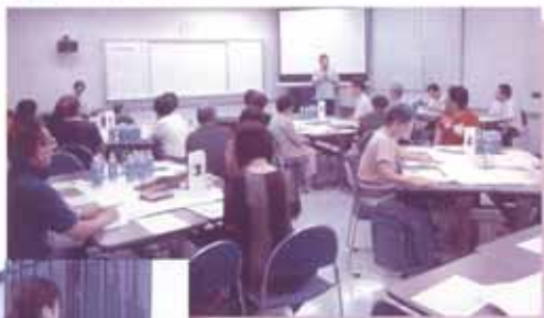
↑「住民同士の意見交換の場：地域福祉座談会」