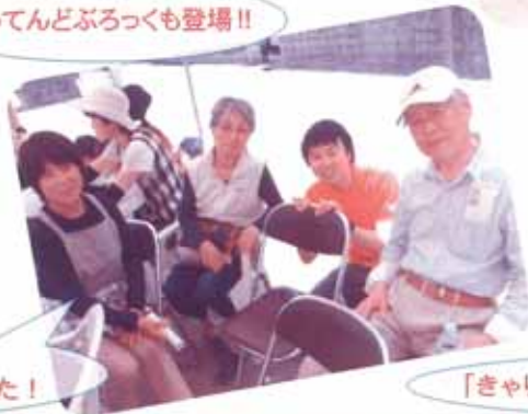
「きゃりーぱみゅぱみゅ」れんがの家に現る!?