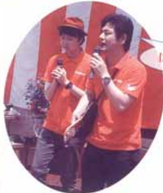
はってんどぶろっくも登場!!