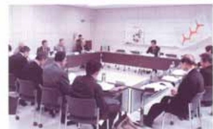
実行委員会の様子

第八回火の国ボランティアフェスティバルが十一月二十一日(土)～二十三日(日)に菊池市の各会場にて開催されることになりました。これは熊本県下各地域に引き継がれており、地域でのボランティア活動がより一層の振興を図り、ボランティアの交流と研鑽、そしてボランティアの輪が広がっていくことを期待して開催されます。合志市、ボランティア連絡協議会、社協がともに企画・実施運営に努めています。