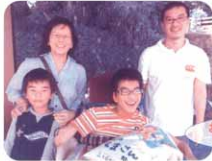
お楽しみ抽選会で、お米ゲット!!