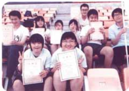
みんな一生懸命頑張りました!

今回出場した8名の選手達には喜びは自信に、悔しさは次の力にして来年への目標にしてほしいです。