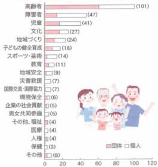
表1：平成25年度ボランティア活動分野