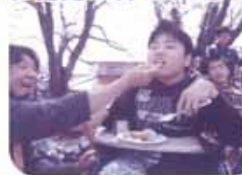
皆で桜の下でお昼ご飯を食べたよ！