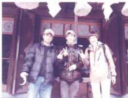
健康に過ごせるよう、祈願しました

3月22日(土)、外出行事で、山伏塚公園へ歩いて行きました！今年、寒い日が続いたせいか、まだまだ桜はつぼみの状態でした…。しかし、とっても暖かい太陽のもとで、れんがの家の子も達と一緒に弁当を食べました。その後、「菊池公園」