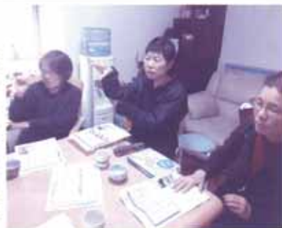
分からない言葉も、優しく、ゆっくり教えてくださいますよ！

手話教室の活動を一時お休みしていましたが、今回3人の当事者ボランティアさんのご協力で、手話教室を再開しました。「聴覚障がいの方とコミュニケーションを取りたい。」「手話検定を受けてスキルアップしたい」という方々が集まって手話の勉強をしています！しりとりや、質問ゲームなどをしながら、楽しく勉強していますよ～。地域の方からの参加もお待ちしております！一緒に手話を勉強してみませんか～？