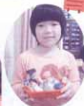
どうやってお弁当箱に詰めようかな～？