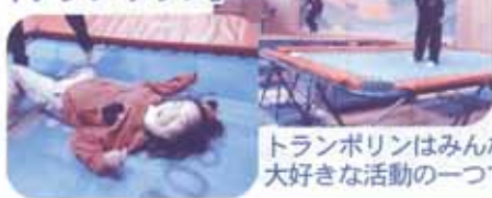
トランポリンはみんな大好きな活動の一つです！

* 障がいをお持ちの方の余暇活動へ皆さまの特技・趣味をご指導いただくボランティアさん募集中です。場所や必要なものはこちらで用意します。詳細は「れんがの家」にお問い合わせください。