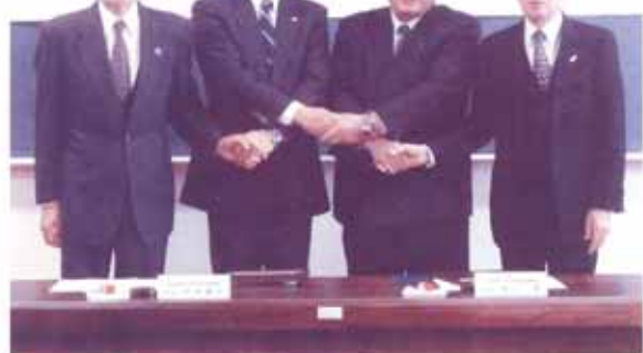
菊池市・合志市・大津町・菊陽町 社会福祉協議会