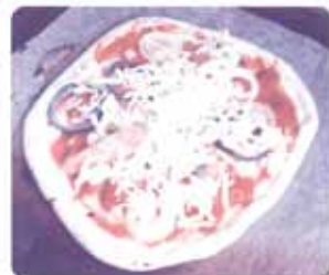
畑で採れた野菜をピザにのせて食べました！

その他にも、月1回茶話会を開き、ご利用者様でやってみたいことや行きたいところなど話し合い、来月の予定を決めていきます。また、日頃の悩みや、聞いてほしいことなどのご相談にも応じます。お気軽にご参加ください！茶話会で外出の企画も立てていきます。