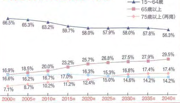
■合志市人口(年齢構成)の推移

見守ります。」という趣旨の低額による住民参加型福祉サービスを平成二二年度から展開しています。 このサービスは、利用者も提供者(サポーター)も事前にご登録いただき、ご利用時には最初にコーディネート(調整)をさせていただきますが、「サービスを利用したい。」という方は増え続けており、最近では毎月一〇〇回以上の支援の実績があり、今後も増え続けることが予測されます。 現在、ご利用者の増加に伴い、サポーターの方の数が不足しているため、社協では随時サポーターを募集しています。登録に必要な二時間程度の講座や、各種サポーター養成講座を実施していますので、多くの市民の皆さまのご参加をお願いします。 なお、活動中のサポーターさんからは「私が間もなく後期高齢者の仲間入りしたときに、今度は支えてもらえるように今のうちから活動に参加している。」や、「自分自身の認知症予防と介護予防のために活動している。」、「他の市町村で行われているボランティアのポイント制に比べ効率が良い。」という声もあります。 誰かのためではなく、将来の自分のための活動、それが住民参加型福祉サービスです。多くの市民の皆さまのご参加をお待ちしております。