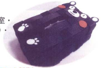
くまモンのティッシュケース(クラフト製作)