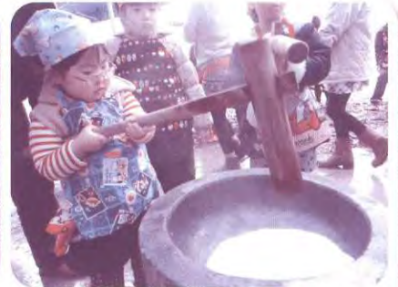
地域の方ともちつき、べったん!