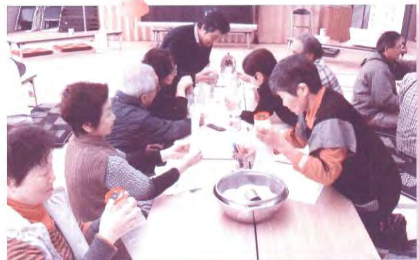
ハイゼックス袋を使って非常食体験

参加者からは「日頃からの近隣との声掛けが重要だと再認識した。参加の仕方がわからなかったが、社協に連絡すれば何とかなることがわかった。災害には強いと言われる合志市においても災害ボランティアセンターの訓練が必要だと感じた。」等の感想が多数寄せられました。