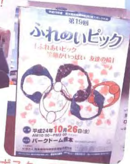
ポスターの原画に入選!