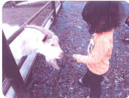
近くの牧場でヤギさんにえさやり

子どもさんの個性にあった支援計画をもとに日常生活の中で遊びを通して基本的な生活習慣の指導を行い、発育を促すサポートをします。 自然にふれあう体験や地域との交流など五感を育てる取り組みをしています。