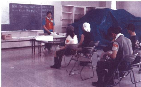
ボランティアの方達へオリエンテーション(説明)を行っている様子