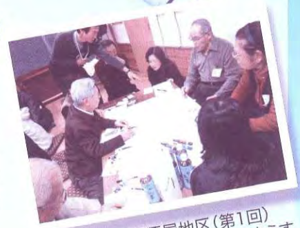
南須屋地区(第1回)グループワークのようす