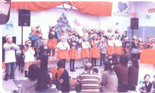
キッズクラブ (放課後児童健全育成事業)