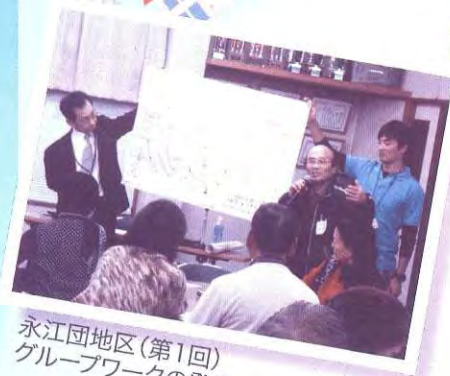
永江団地区(第1回)グループワークの発表

座談会の参加者からは、地域の困りごとをはじめ「区の集まりに社協職員を呼んで福祉講座を開き、福祉に関する知識と意識を高めたい。」「ひとり暮らし高齢者等を把握し、近隣で共有するためのマップをつくり、みんなで見守りたい。」などたくさんの意見が出ました。