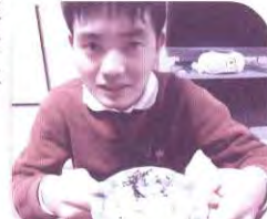
自分でフルーツとチョコをトッピング☆

それぞれに個性的な飾り付けをしておいしくいただきました。みんなとても笑顔でした。 (*^_^*)