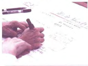
永江団地区(第2回)グループワーク