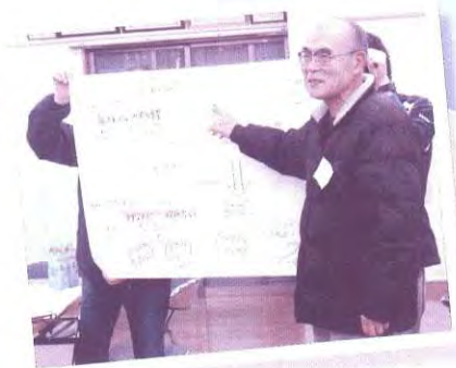
永江団地区(第2回)グループワークの発表