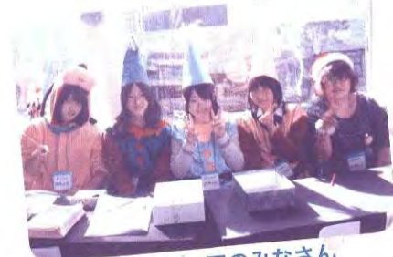
ボランティアのみなさん

300名以上の方の参加があり、 『赤ちゃん～おじいちゃん・おばあちゃんまで 一緒に参加し楽しめたのがよかったです♪』