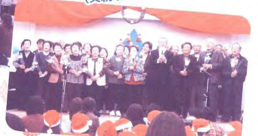
上須屋いきいきサロン (地域サロン)