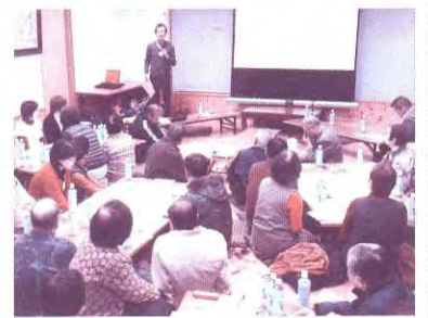
南須屋地区(第1回)佐伯氏による説明のようす