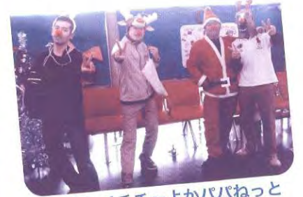
コウシノチチ～よかパパねっと (父親ネットワークづくり事業)