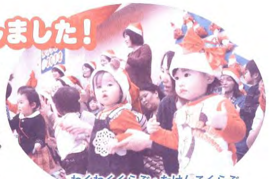
わぐわぐくらぶのたけんくらぶ (就園前の親子のひろば)

『家族で楽しい時間でした♪』 とたくさんの感想をいただきました♪ 皆様のご来場本当にありがとうございました♪