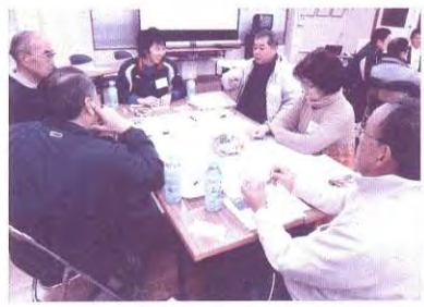
永江団地区(第2回)グループワークのようす