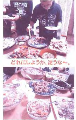
どれにしようか、迷うな〜。