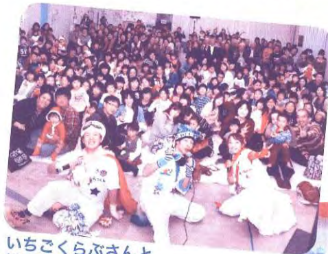
いちごくらぶさんと 総勢300名以上の参加者のみなさん

今年は大人気の童謡ユニット「いちごくらぶ」と歌あり、踊りあり、ゲームありの元気いっぱいのお楽しみ音楽発表を行いました♪