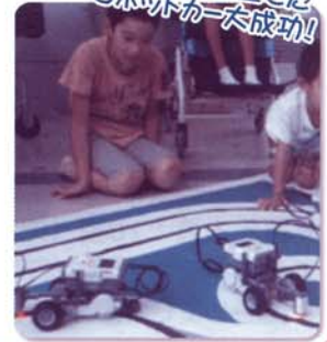
自分で組み立てたロボットカー大成功!