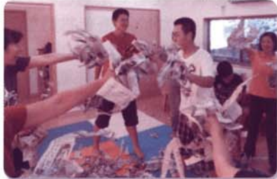
ハハハで気分はチャアガール!

身近な地域の方と交流をしたり、今までにない体験・経験をすることで、いろんな刺激を受けたり、自分の好きなことを見つけたりきっかけになったりしました。いつも以上の子どもの笑顔がたくさん見ることができました。