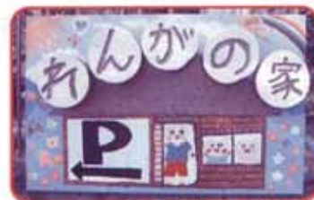
手作りの看板です!この看板を目印に!