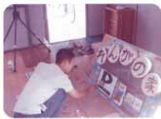
丁寧にニス塗りに専念中です。