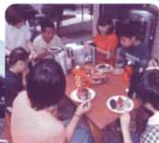
▲庭先でのランチタイム