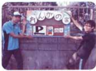
出来上がった看板の前でワンショット!