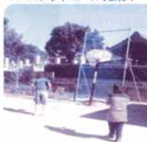
▼バスケットゴール完成!

平日の放課後や土曜日を中心に、手作りウィンナー・パン作り体験、カラオケ、シャボン玉遊び、バスケットボール等、「れんがの家」では、子供たちの素敵な笑顔と元気な声が絶えません。そんな子供たちにたくさんの力と勇気をもたらしています。平日放課後からのお預かりや土曜日のお預かりを実施します。急な用事が出来てしまったり、お仕事をお持ちの保護者の皆様も、少し休憩したいときや気分転換に、お気軽にご相談・お申し込みください。