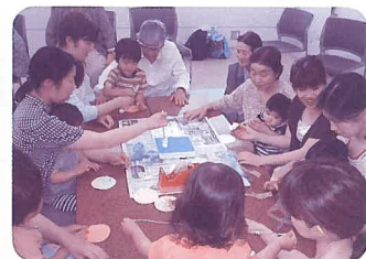
閉じこもり・介護予防デイサービス