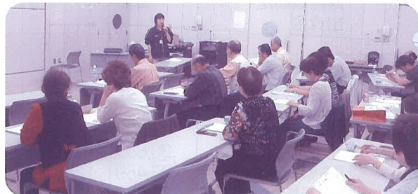
▲地域支えあい事業

「生活の中のちょっとしたお困りごと」を住民同士のささえあい活動でサポートする仕組みを本年度より開始しました。地域の自発的な支えあい活動へと広がり、安心して生活するための支えになっています。また、活動への人材育成にも努めています。