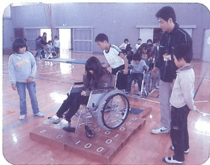
小学校での福祉教育▶

合志市内の小学校、中学校、養護学校で実施するボランティア活動の支援と福祉教育のための活動を行っています。