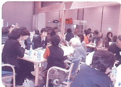
▲輝き館ひかりでの地域福祉座談会

平成21年に開所した南ヶ丘福祉支援センター輝き館ひかりにおいて、福祉サービスの提供やボランティア活動の支援、そして身近なところで福祉の相談に応じられるために拠点整備を実施します。また、緊急時や介護疲れを癒すための宿泊サービスを行っています。