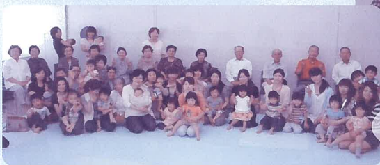
わくわくくらぶ 黒石ふじサロン