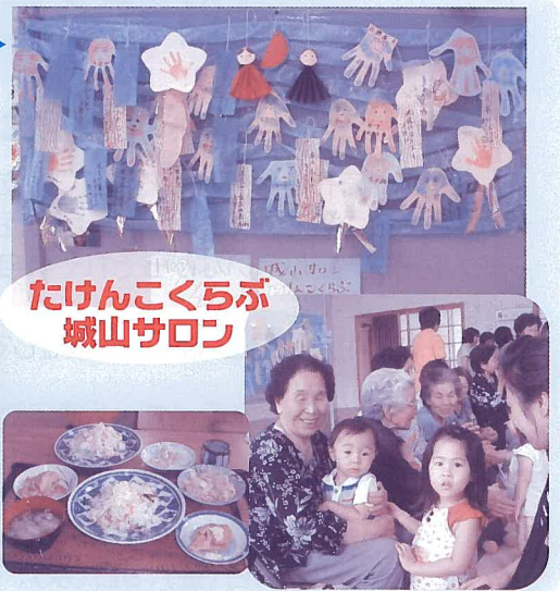
たけんこくらぶ 城山サロン