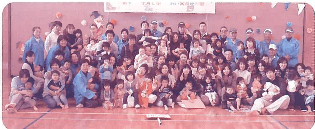
▲ファミリーサポート交流会

地域の子ども達や親子がいつでも安全に集い、交流できる場の整備や子育てに関する研修会、講演会など幅広く実施しています。また、研修を受けた子育て会員が子どもを預かり育児の支援をするサポート制度を推進しています。